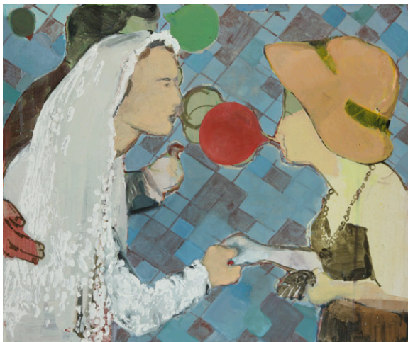
Small Talk , 2011 Gemischte Medien auf Leinwand 100 x 120 cm

Die GALERIE MICHAEL W. SCHMALFUSS arbeitet seit mehr als 10 Jahren mit national und international anerkannten Künstlern zusammen. Zusätzlich vertritt sie ihre Künstler auf zahlreichen internationalen Kunstmesse.